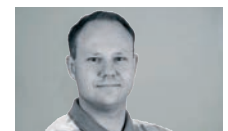
Ole Johnny Borge WIRTGEN AS