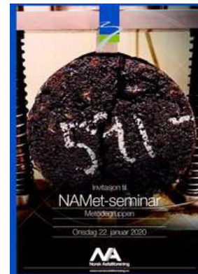
NAMet fagseminar 22. januar 2020, Oslo