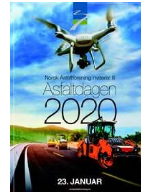
Asfaltdagen 2020 23. januar 2020, Oslo